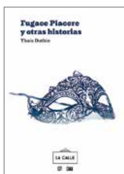
Colección On Off