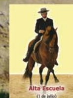
Alta Escuela (1 de julio)