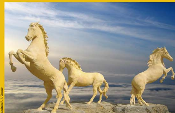
Organizan: HERMANDAD DE LA AMARGURA, (SAN FELIPE) EXCMO. AYUNTAMIENTO DE CARMONA Lugar: Instalaciones PEREZ SIERRA, (Pol. Ind. Brenes) salida ctra. El Viso