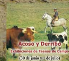
Acoso y Derribo Exhibiciones de Faenas de Campo (30 de junio y 1 de julio)