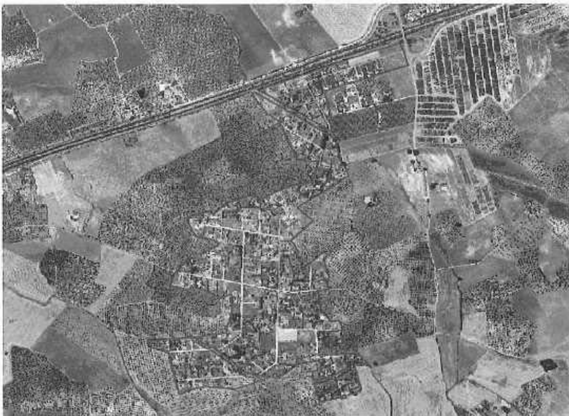
Delimitación de Suelo Urbano No Consolidado, Área de Reforma Interior y Área de Reparto