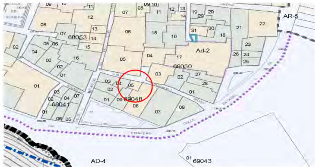
Localización de la parcela en el Plano O.4 del PEPHHC

El edificio se sitúa sobre una parcela cuya referencia catastral es 69004805, con una superficie de suelo de 52 m 2 . Dicha parcela catastral coincide con la reflejada en el plano O.4 del PEPHHC, que contiene el parcelario del Conjunto Histórico de Carmona. Tiene forma aproximadamente cuadrada, con una fachada de 7,77 m. y un fondo de de algo mas de 7 metros.