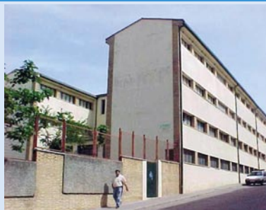
BEATO JUAN GRANDE