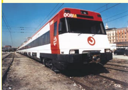
- Tren de cercanías hasta Carmona.