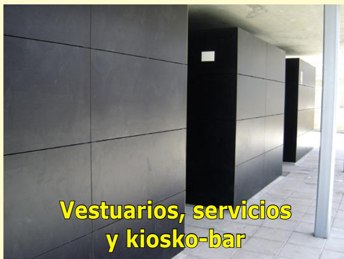
Vestuarios, servicios y kiosko-bar