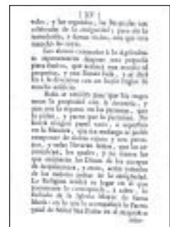
▼ PÁGINA (XV).