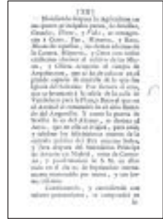
▲ PÁGINA (XII).

Continuando, y extendiendo este mismo pensamiento, se compondrà en / (xiii) la primera tarde la Mascara de la misma Fidelidad, Amor, y Gozo, que hicieron la publicacion, y à quienes toca conducir esta especie de triunfo, ò espectáculo de los abusos contrarios à la Agricultura, que la sabiduria, y justicia del Rey Nro. Señor acabarán de exterminar: siguiendo las pisadas de su augusto Padre el Señor Don Carlos III: de las Virtudes , y Ciencias sin las quales no puede prosperar la Agricultura, y cuyo aumento y perfeccion espera con tanto fundamento la Nacion del amor de S. M. à sus vasallos; y de los Dioses que simolizan, ò la proteccion, ò los efectos de la Agricultura, ò representan los inventores de sus principales instrumentos, y trabajos: cerrandola