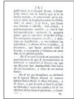
▲ PÁGINA (X).