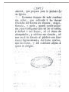
▲ PÁGINA (XVI).