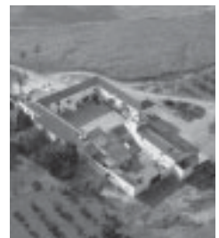
▼ Cortijo de la Vega.