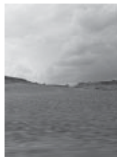
▼ Puerto de Alcaudete.

“se sintió cruzado por un escalofrío de recuerdos de niño en el pinar; cacería de lagartos a pedradas, pegajosas y arañadas las rodillas en la tiesa cucaña de los troncos que llevan hasta las duras piñas piñoneras, y las candelitas aquellas de los hoyos, mientras escuchaban los silbidos del viento, acurrucados en el refugio improvisado con ramajes bajo los primeros goterones del chaparrón.”