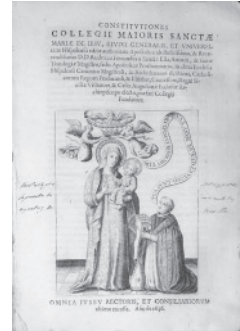
▲ Portada de las Constituciones del colegio de santa María de Jesús. Sevilla, 1636.

13. GONZÁLEZ JIMÉNEZ, Manuel. “El testamento de Maese Rodrigo”.- En: Maese Rodrigo... pp. 73-77.