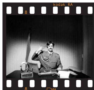
España / 18 minutos / 2002