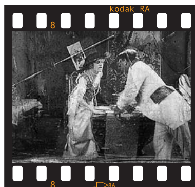
México-España / 49 minutos / 2003