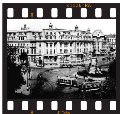
Rumanía / 50 minutos

Premio del jurado al mejor documental Karmocine en defensa del patrimonio