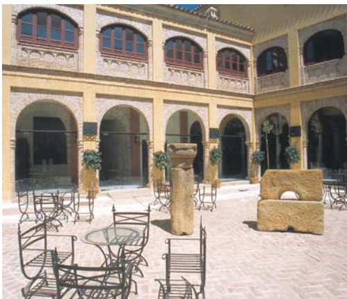
Hotel Alcázar de la Reina