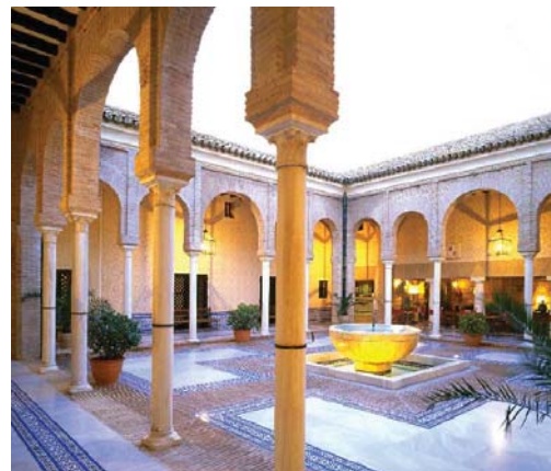
Parador Alcázar del Rey Don Pedro