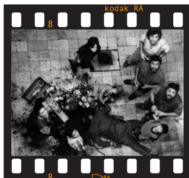
México / 18 minutos / 2002